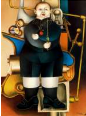
Boy with machine